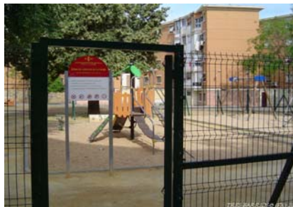
Parque Infantil de la calle Andrómeda (arriba) y el nuevo de calle Galaxia (abajo)

Es precisamente en esta zona, en la calle Galaxia donde se ha instalado el último parque infantil, completando el equipamiento que ya formaban el parque infantil de la calle Astrolabio y el de la calle Andrómeda, aumentando la oferta de zonas de juegos y de ocio para los más pequeños en el entorno de Madre de Dios, Los pájaros y Las Candelarias.